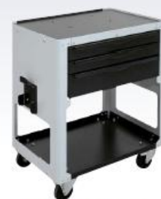
GYSPRESS 8T Workstation réf : 054233