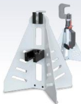
Support réf : 054158