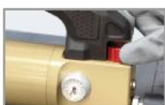
nyomás kontroll 0 > 8 bar