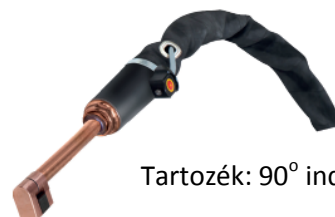
Tartozék: 90° induktor