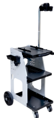
Spot 800 kocsi +