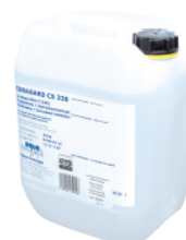
Hűtő folyadék 10 lit.